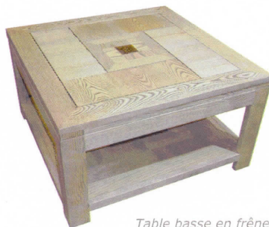
Table basse en frêne 1 ère CAP 2015