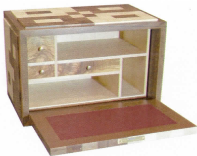
Médaille d'or régionale MAF ébéniste

Il est suffisamment soigneux pour effectuer de belles finitions.