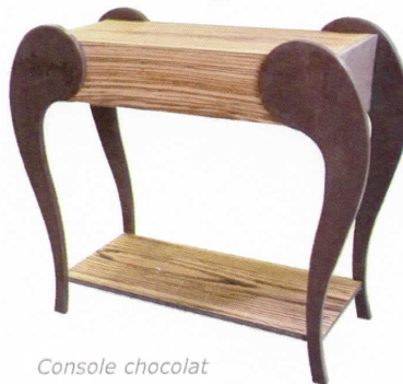
Console chocolat 2 ème CAP 2015